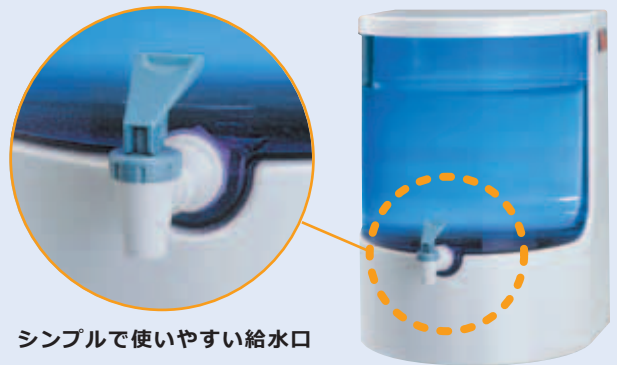
シンプルで使いやすい給水口

ウォータープラネットは、自然の浄化作用に着目して開発された「海水」を「真水」に変えるハイテク濾過膜「逆浸透膜」と採用。もっとも微小なウイルスよりも更に細かいフィルターが代おき深夜環境ホルモンも完全kン井除去し、本当にキレイな水を造り出します。